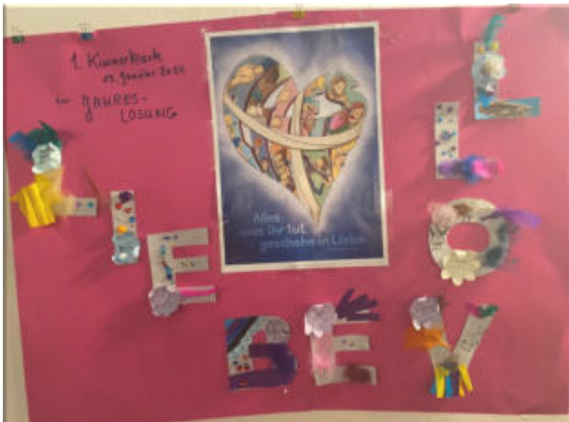
Kinnerkark Januar 2024